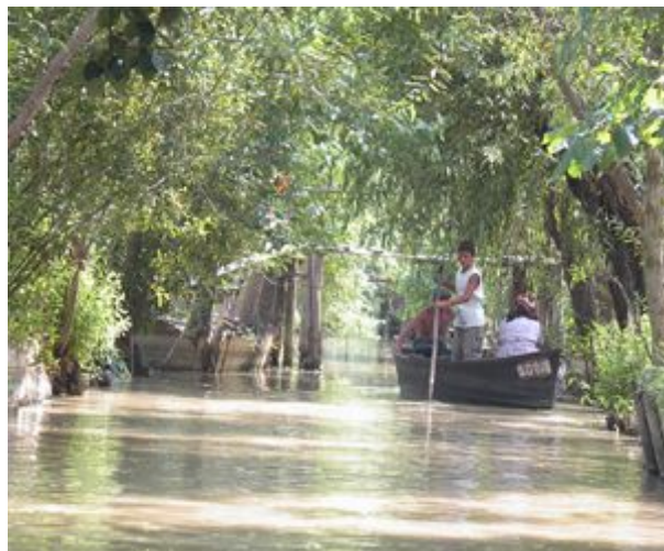
v kanáloch Vilkova

Keď nastupujeme do vlaku, pršať prestáva a už sa objavujú babyčky s ponukou ubytovania.