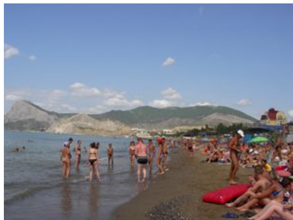
mestská pláž v Sudaku

Ideme preto popri pobreží od mesta, smerom, kde je na mape naznačený kemping. Na opačnej strane stojí na skale historická pevnosť, ale určite tam bude veľa ľudí a to nás odrádza.