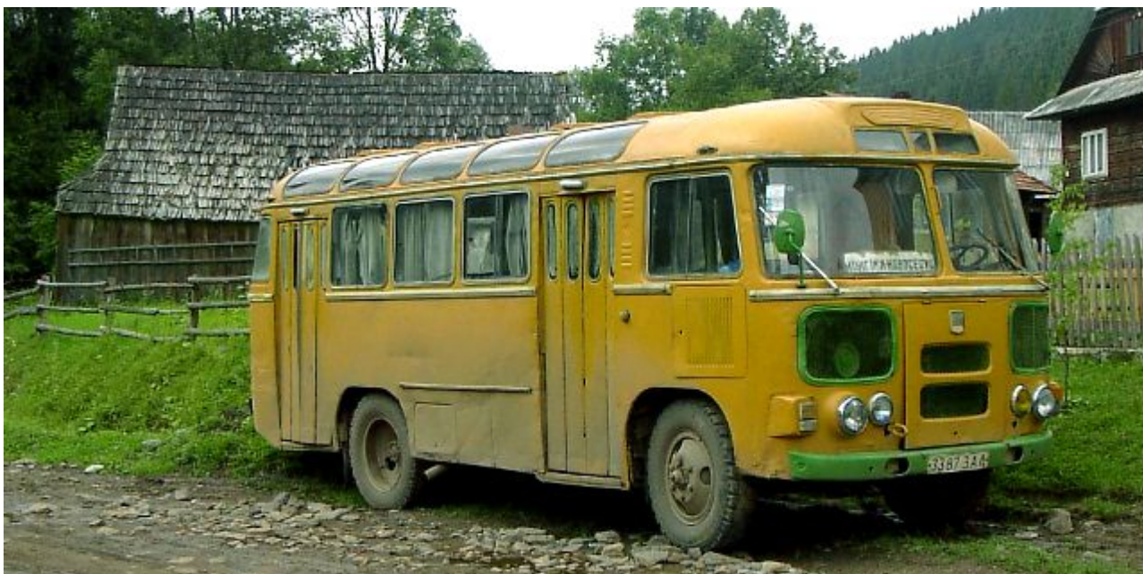
autobus v Zakarpatsku

Prímestský vláčik s lavicami na sedenie. Veľmi lacný a pomalý, má množstvo zastávok. Cez vláčik často prechádzajú predavačky s ovocím, nanukmi, pirohmi a nápojmi.