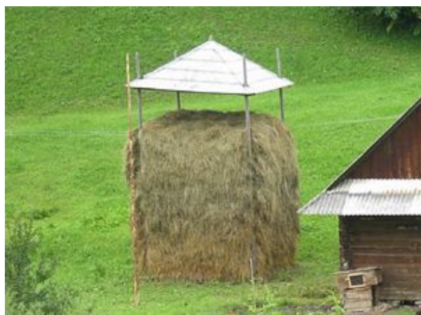
oborog na uskladnenie sena