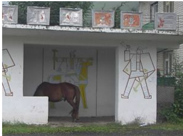
koň schovaný pred dažďom v zastávke

V magazíne neuvážlivo oslovujem staršieho deda s otázkou, ako je to s autobusmi a Novoselicou. Lenže nanešťastie narážam na opilca a tak sa len trochu objímame a potom už od predavačky zisťujem, že autobus už nepôjde a na maršrutku sa tiež nemáme spoliehať.