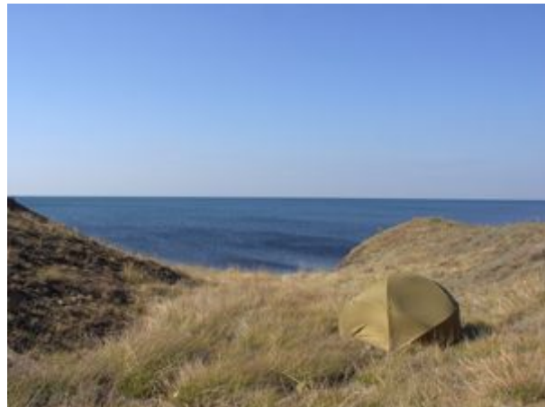
stanovanie nad útesmi za Sudakom

Po opustení posledného domu sa dostávame na cestu vedúcu k našemu cieľu - dedine Solnočnooselo. Cesta ide cez bukový les, ktorý pripomína Malé Karpaty. V Solnočnoosele ďalšia otázka, či sme zablúdili a už sme v magazíne. Tu prinášame zvedavým predavačkám veľkú zvesť, a totiž že Československo už neexistuje a rozdelilo sa na dva štáty. Neskoro, ale predsa.