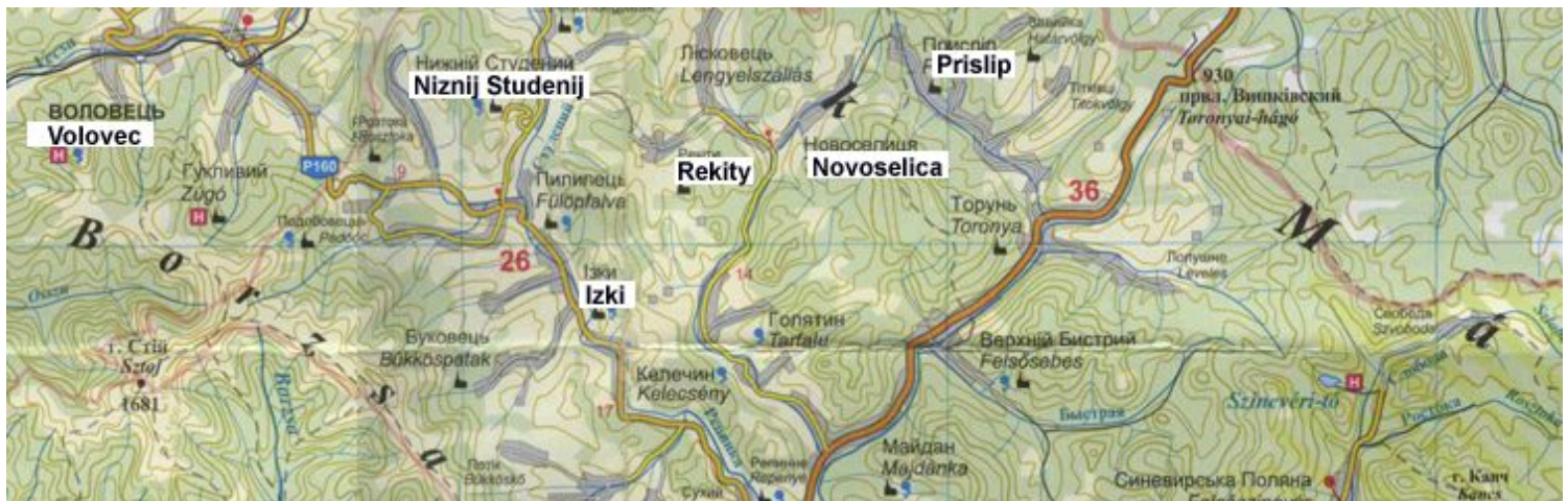
Zakarpatsko, časť Boržavy a Verchoviny