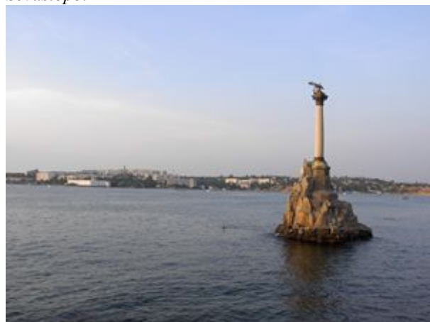
Sevastopol' - pamätník potopeným lodiam