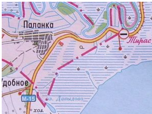
prechod cez Moldavsko