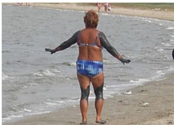
v Olenivke je akési liečivé bahno