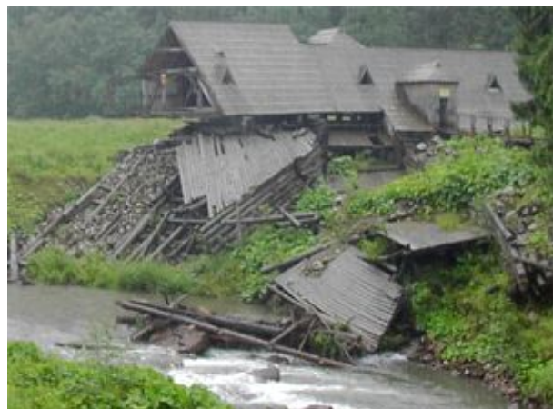
múzeum pltníctva poškodené povodňou

Za Sinevirom stojíme v daždi a stopujeme. Hneď druhé auto zastavuje a po chvíli nás víta Mižirja. Tu čakáme asi polhodinu a už ide autobus priamo do Užhorodu. Po štyroch hodinách trmácania v Užhorode naskakujeme to taxíku a vezieme sa na slovenskú hranicu. Ponáhľame sa, aby sme stihli autobus do Košíc.