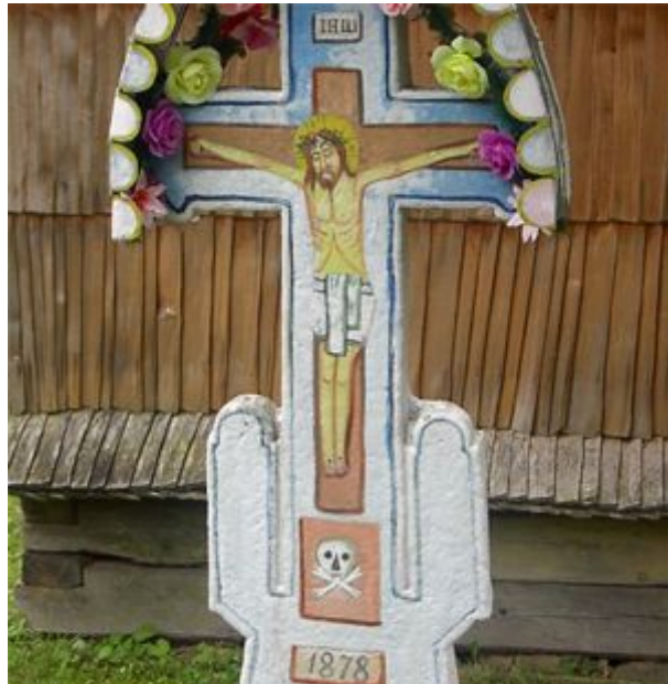
Ježiš pri drevenom kostolíku