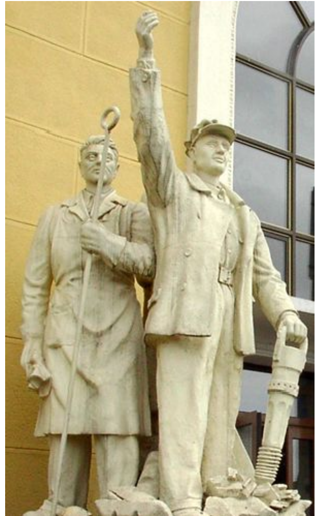
vlaková stanica v Mukačeve