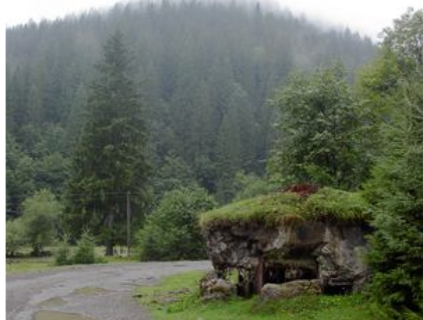
bunker linie Arpád

Múzeum dokumentuje spôsob ktorým sa najmä v prvej polovici 20. storočia splavovalo drevo do rovnejších častí krajiny. Z driev sa vyrobili plte, ktoré sa zoradili pred bránou umelo vytvorenej priehrady. Tá sa potom otvorila a nasledovalo akčné surfovanie na veľkej vlne. Tento nebezpečný spôsob sa používal z dôvodu, že ešte neexistovali dobré cesty a tok riek bol v prirodzenom stave príliš plytký na splavovanie. Na Slovensku možno takúto priehradu nájsť napríklad v dedinke Bacúch pár kilometrov nad Breznom.