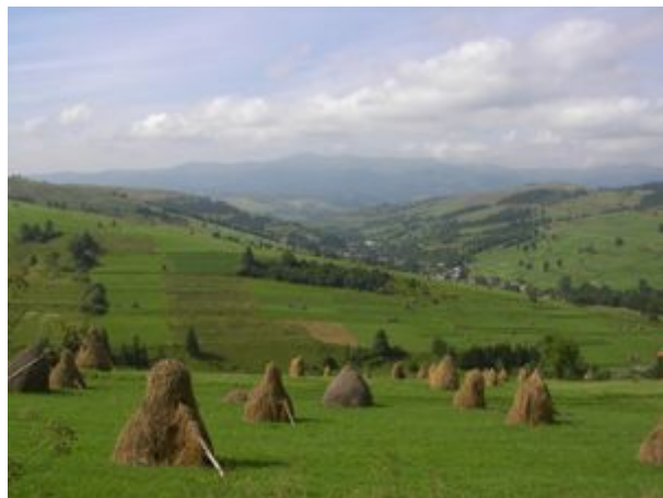
verchovinská romantina, na pozadí polonina Boržava