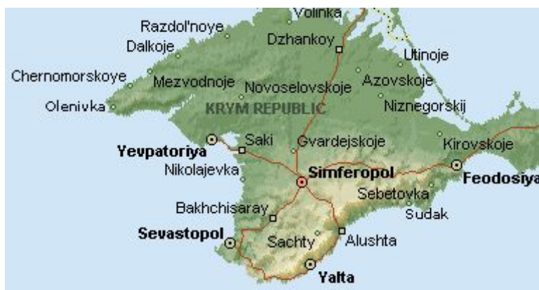
mapa Krymskej republiky

Pláž Vidrada je celkom obstojná, piesková, len je na nej dosť ľudí. Na obzore vidieť mnoho nákladných lodí, no more je celkom čisté a plné medúz. O niečo neskôr, už vo vlaku do Simferopolu stretáme jedinú grupu Slovákov v tejto krajine. Pre porovnanie, českých skupín cestovateľov sme stretli aspoň sedem.