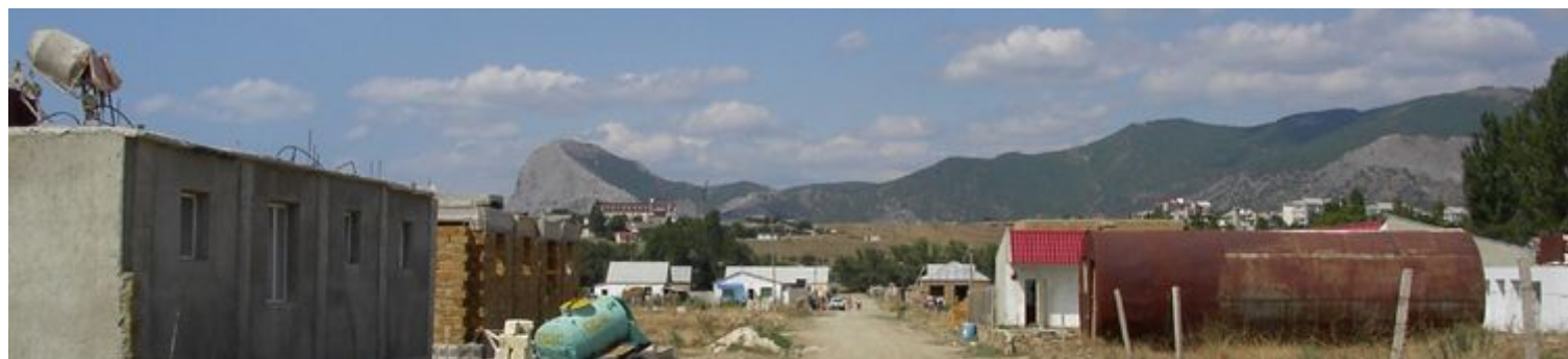
ulica v Sudaku