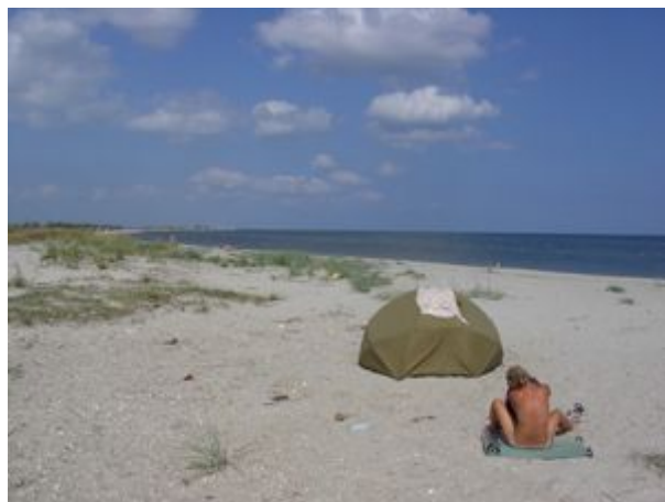
Čierne more pri dedine Primorske