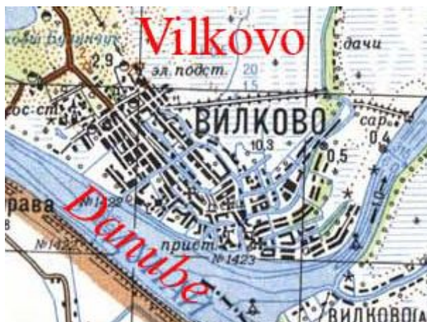
Vilkovo so sieťou kanálov