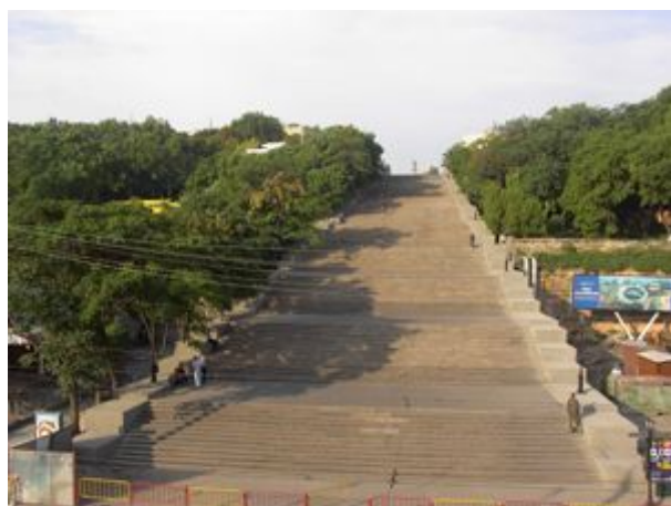
schody kniežaťa Potemkina v Odesa

A tiež sa objavujú žobravé špinavé cigánske deti a tiež tu dostať skvelé