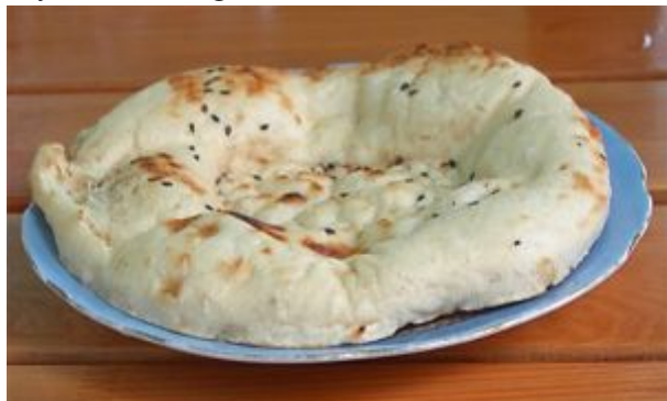
tatársky chlieb - pita