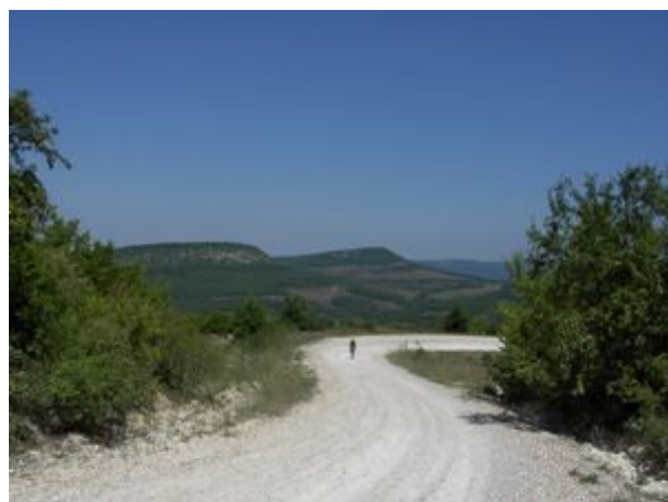
cesta do dedinky Visoko