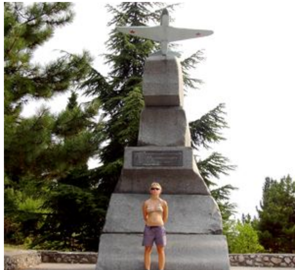
Malachov kurgan v skutočnosti..

Vybaľujeme syr, ktorý sme kúpili ešte ráno a niekoľkohodinový pobyt v batohu na priamom slnku mu vôbec neurobil dobre. Svetložltú farbu zmenil o niekoľko odtieňov k tmavej, ale najmä z neho tečie množstvo oleja. Napokon ho za veľkého boja s hmyzom zjeme, ale gastronomický vrchol tejto cesty to rozhodne nie je.