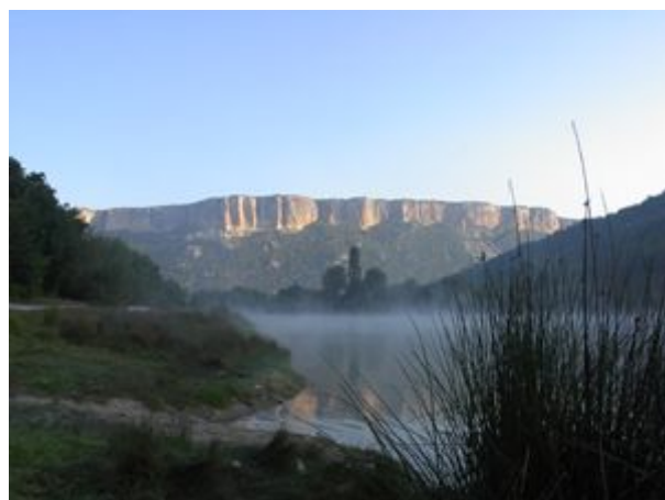
skoré ráno pri jazere nad Baštanovkou